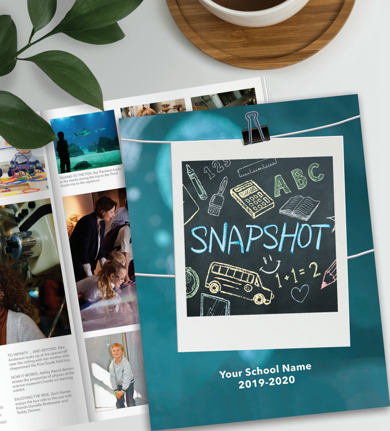
TALKING TO THE FISH. Raj Therimon looks at the sharks during the trip to the Third Grade trip to the aquarium.